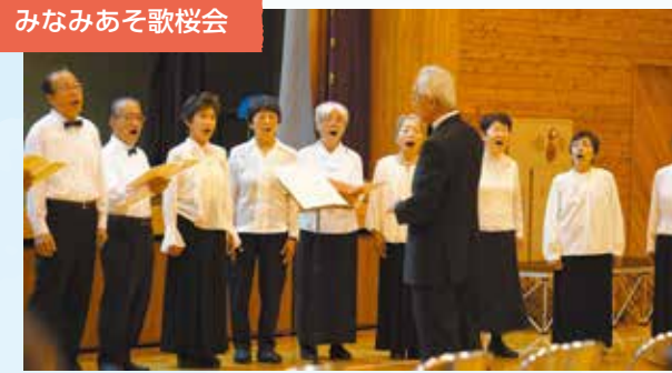
みなみあそ歌桜会

自宅やサロンで簡単にできる体操を楽しく学ばせていただき会場が笑顔と笑い声に包まれました。