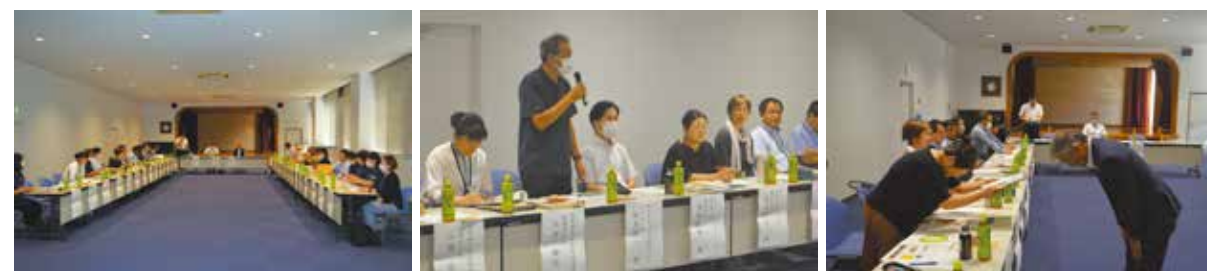
グリーンコープさんからの活動状況報告の様子

住み慣れた地域で誰もが安心して暮らしていけるよう、今後も行政や関係機関、団体と連携しながら地域全体で支え合う地域作りに取り組んでいきます。引き続きご協力をよろしくお願い致します。