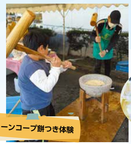
グリーンコープ餅つき体験