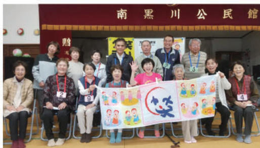
▶ ふれあいサロンさん