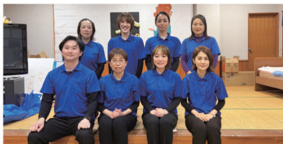
デイセンターなみの職員

身体介護や生活援助・機能訓練等を行いつつ「高齢者の社会参加をすすめる」という役割の元、介護の業務にとどまらない、地域の方が気軽に立ち寄り、お困りごとを受け止められる、地域に密着した事業所を目指します。