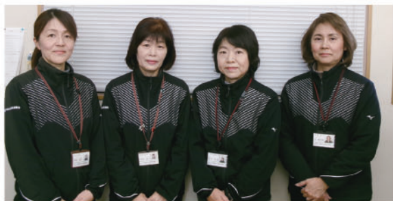
阿蘇市社協 春りんどう職員

パスポート用の印紙・証紙の販売や社協の窓口など、支所としての業務も行っています。