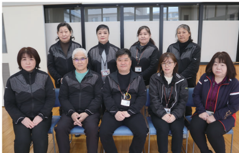
指定介護予防支援事業担当職員

住宅改修や福祉用具購入の理由書の作成も行ないます。介護申請等お気軽にご相談ください。