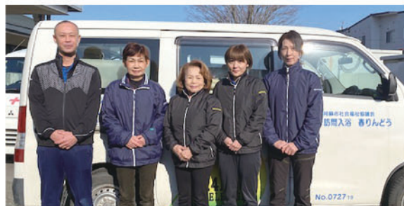
訪問入浴介護 春りんどう職員