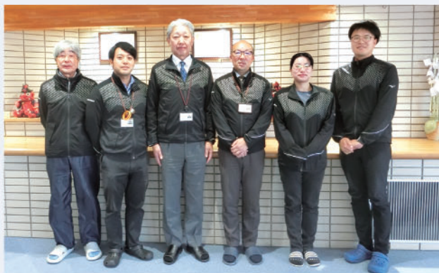
本所・一の宮 総務課職員

法人運営を通じ、温かく親しみやすい社協になるように心がけております、社協の総合窓口でもありますので、生活の困りごとがあればお気軽にご連絡ください。