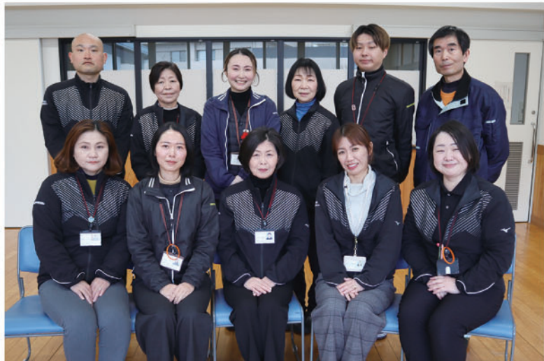
包括的支援事業担当職員