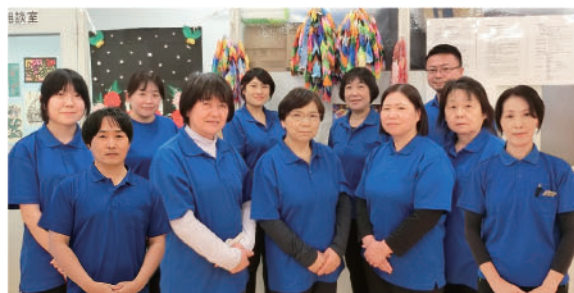
デイセンターごがく職員

食事や入浴などの支援や心身の機能を維持・向上するための運動やレクリエーションなどを日帰りで行い、福祉サービスの情報発信と相談機能の充実を図りながら地域に愛される事業所を目指しています。