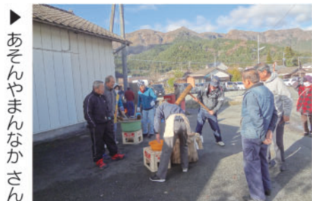
▶ あそんやまんなかさん