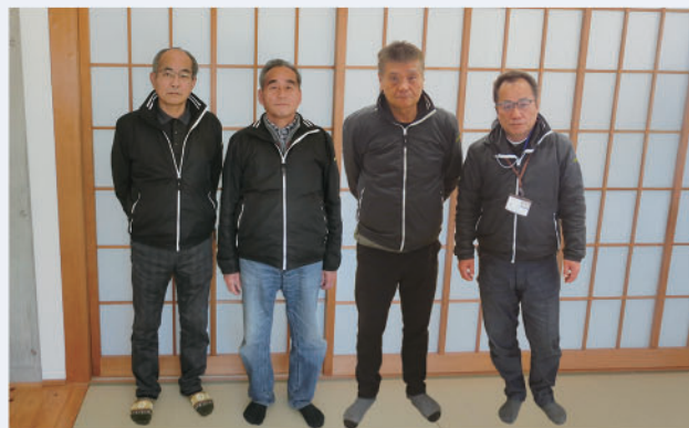
高齢者センター・温泉センター職員