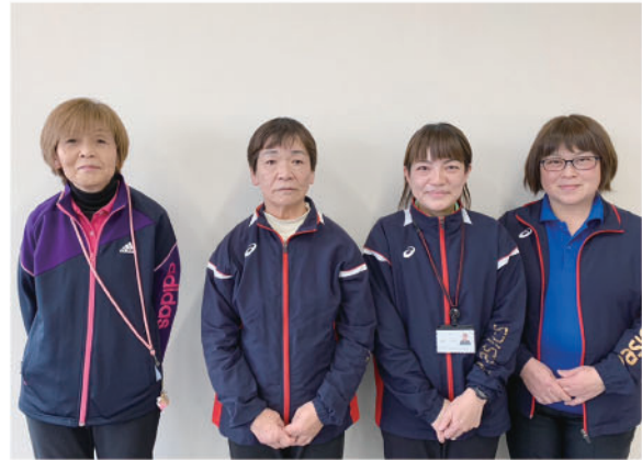
ヘルパーステーションあそ職員