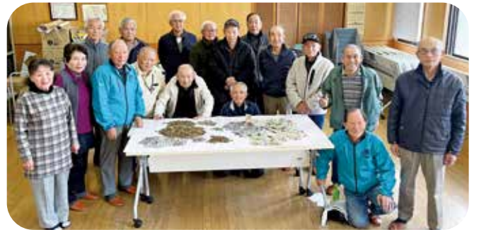
シニアクラブの皆さまにご協力いただきました。