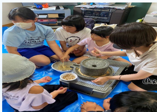
石臼で団子づくり体験