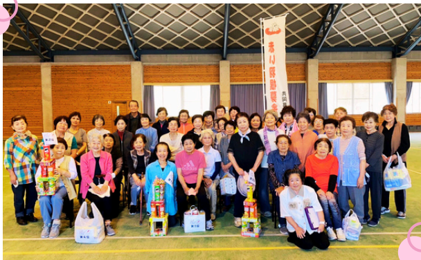
モルック大会を開催