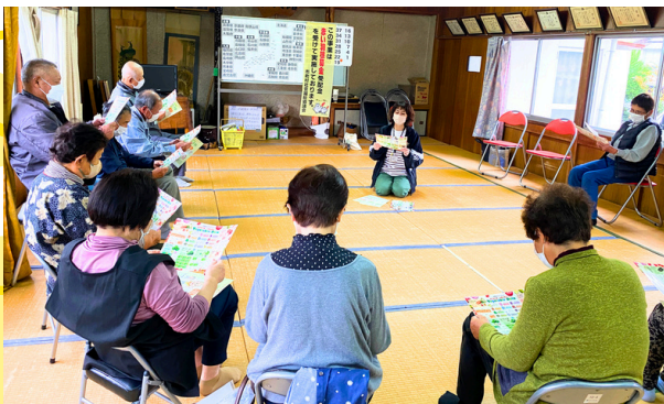
保健師による健康教室