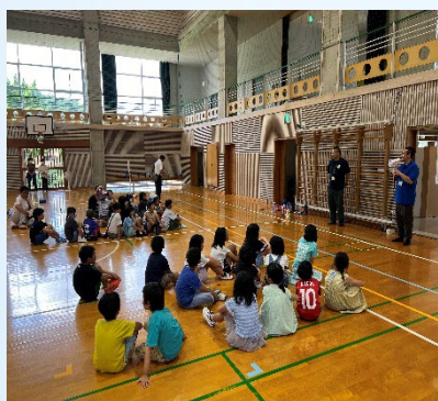
楠キッズ交流会（モルック）