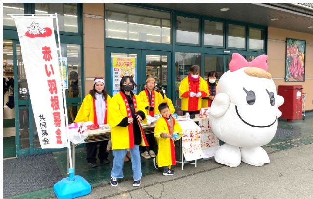
令和5年12月 街頭募金の様子(子どもに夢をはこぶ会)小中学生、保育園児のお手伝いもありました♪