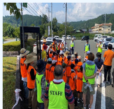
クリーンアップ大作戦