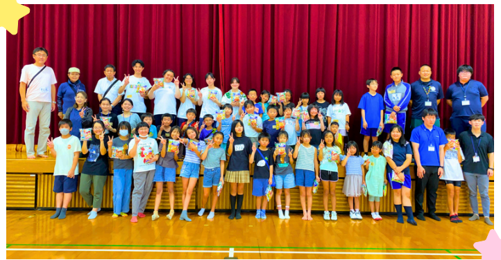
楠キッズと交流会