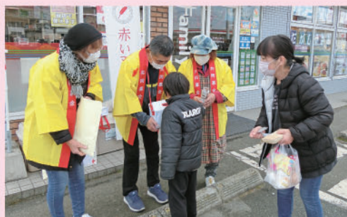
令和5年度 街頭募金の様子