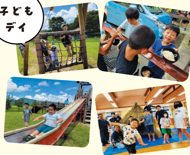
小地域でおこなう活動